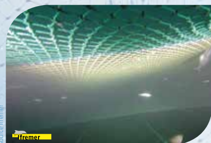
La nappe séparatrice vue depuis la gueule du chalut

> L'objectif de ces premiers essais était d'évaluer la capacité de séparation du chalut. Les essais ont permis de valider la bonne tenue de la nappe (et du chalut en général) en action de pêche. Même si des réglages semblent nécessaires, une séparation est belle et bien effective et les résultats sont encourageants.