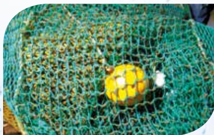
Boule dispersive associée au panneaux à mailles carrées merlu

> Ce dispositif ne semble pas d'avoir d'effet majeur sur la réduction des rejets.