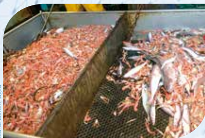
A gauche : la poche du bas (majoritairement langoustine). A droite la poche du haut (poisson)